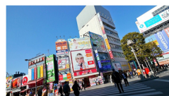
ย่านอิเคบูกุโระ (Ikebukuro)