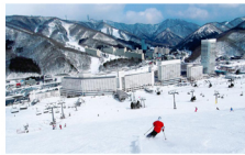
พักที่ นาเอเบะ ปรินซ์ สกีรีสอร์ท Naeba Prince Ski Resort