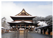
เช้า - เที่ยวใน จ.นากาโน่ (Nagano) ไหว้พระวัดเซ็นโคจิ Zenkoji Temple

วันที่ 3 เที่ยวใน จ.นากาโน่ (Nagano) และ จ.ชิกะ (Shiga)