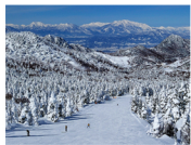
บ่าย - เที่ยวในเมืองชิกะ Shiga เดินทางสู่ ที่สูง ชิกะโคเก็ง Shiga Kogen ชมลิงหิมะ Jigokudani Monkey Park เข้าพักโรงแรมพร้อมเขื่อนเซ็นโนโรงแรม ** พักที่ Shiga Kogen Prince Hotel**