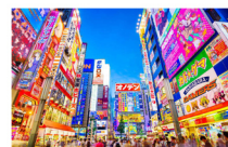
ย่านอาคิฮาบาระ (Akihabara)

** พัก Shin Yokohama Prince Hotel จ.คานากาว่า (Kanagawa) **