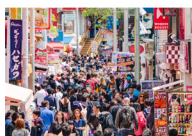
ย่านฮาราจุกุ (Harajuku)