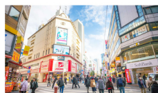
ย่านคิจิโจจิ (Kichijoji)