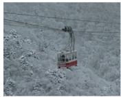
นั่งกระเช้าดรากอนโดลา Dragondola ความยาว 5,481 ม.